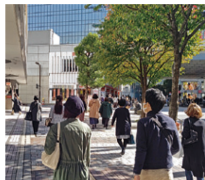
景気の「持ち直し・足踏み」が賃貸需要にどのように影響するか、市場の動きに目が離せません

経済活動の正常化への期待感による投資需要等を受け、前期と比較すると、とくに商業地において横ばい・下落地区数が減少し、上昇地区数が増加したものです。 マンション市場の堅調さから住宅地価は上昇を維持 こうした傾向の主要要因として、「住宅地ではマンション市場の堅調さが際立ったことから引き続き上昇を維持し、商業地では主に地方圏において新型コロナウイルス感染症の影響等により下落している地区が残るものの、経済活動正常化への期待感や低金利環境の継続等による好調な投資需要等から多くの地区で上昇、横ばいに移行した」と説明しています。 一方、足元の賃料の傾向では、「マンションの平均募集家賃は、東京都下・埼玉県・千葉県・大阪市の4エリアが3カ月連続で全面積帯で前年同月を上回りました」(アットホーム、1面「賃貸マーケット情報」参照)。