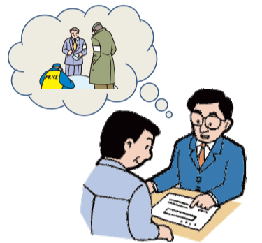
ガイドラインが策定され、告知の判断基準が明確になりました

告知については、原則として、人の死に関する事案が、取引の相手方等の判断に重要な影響を