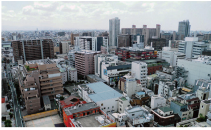
「過去の人の死」に対処して、明文化されたことで、円滑に進んでいます

国土交通省から「宅地建物取引業者による人の死の告知に関するガイドライン」が公表されて1年が経ちます。深刻な話も聞かれる中で、ガイドラインの整備で変化が見られるようになってきました。