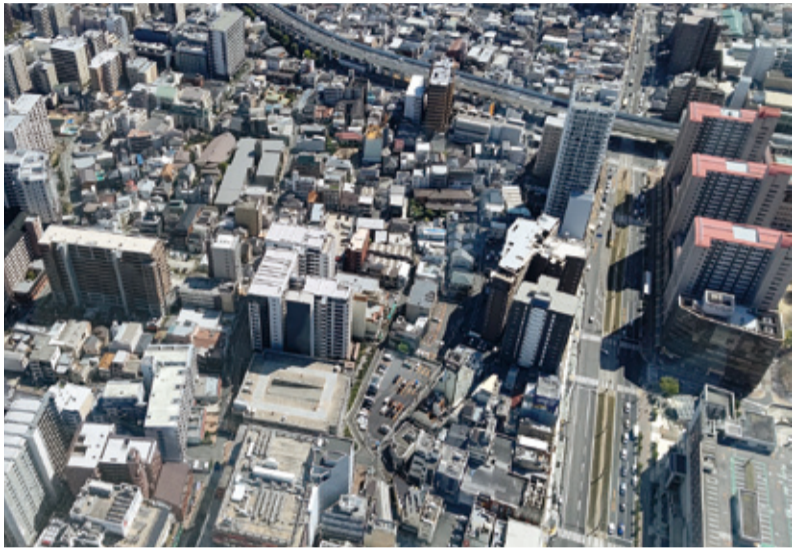
景気は改善しつつ上向きに転じる一方、資材価格の高騰などの不安要因も見逃せません。気になるのは、今後の「低金利政策」の行方です