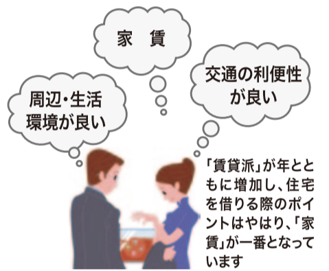
「賃貸派」が年とともに増加し、住宅を借りる際のポイントはやはり、「家賃」が一番となっています

調査結果から、持ち家志向といわれる中、「持ち家派」に対して、「賃貸派」は約20%で、平成25年以降最も高い割合となっています。年代別に見ると、20代までの各年代で、ほぼ平均して20%台を占めています。賃貸派の理由としては、「住宅ローンに縛られたくない」が最も多く、次いで「天災時に家を所有していることがリスクになると思う」「税金が大変」と続き、「仕事等の都合で引越しやすい可能性がある」「家族構成の変化で消費者の最新の賃貸ニーズを汲み取って、賃貸経営に役立てたいものです」