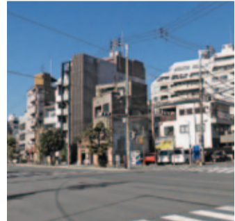
社会の動きと市場ニーズに対して、常にアンテナを巡らしていることが必要です

屋内壁掛蓄電システムを標準搭載するもの。賃貸住宅の多様化とともに、性能アップが急速に進んでいます。 海外情勢に対する懸念の一方 改元や大型連休への期待感 東日本旅客鉄道(JR東日本)は、グループ会社のジェイアール東日本都市開発と連携し、「提案型賃貸住宅」の推進のため、隣接する旧社宅・旧寮をリノベーションして、ファミリー向け賃貸住宅、シェア型賃貸住宅を中心とした暮らしを提案し、2026年度までに管理戸数3千戸を目指す、と発表しました。鉄道会社の営業対策から賃貸事業への進出が加速化しています。